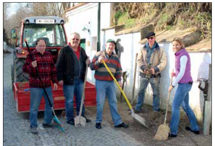
FRÜHJAHRSPUTZ IM RADYWEG: Um Poysdorf im Frühjahr in vollem Glanz erstrahlen zu lassen, versammelten sich wie alle Jahre wieder viele fleißige Hände im Radyweg um einen Frühjahrsputz durchzuführen. Heuer beteiligten sich auch die Vorstandsmitglieder des Tourismusvereines.