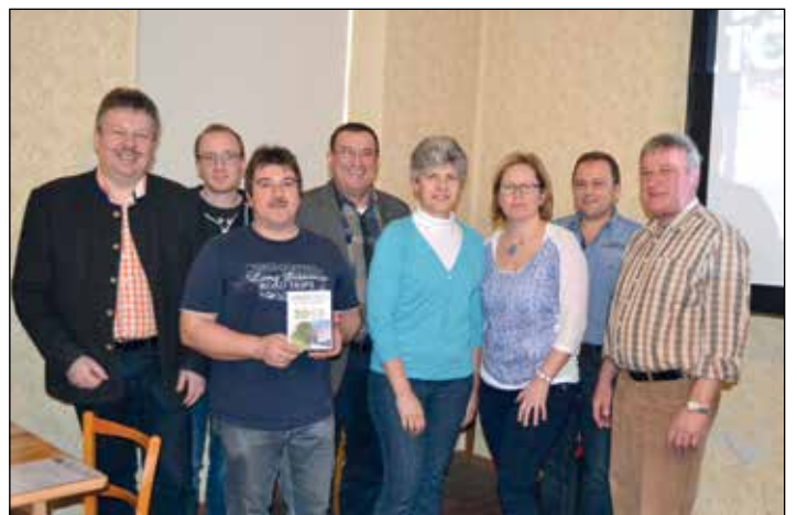
JAHRESRÜCKBLICK: Der Verein Altruppersdorf Aktiv informierte in einen interessanten Rückblick über die Ortsaktivitäten des vergangenen Jahres. Herzlichen Dank allen Vereinsmitgliedern für ihre Mitarbeit am gesellschaftlichen Leben in Altruppersdorf.