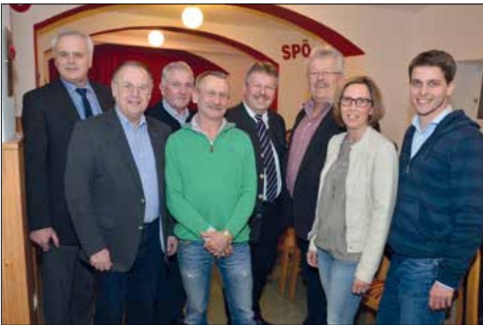
25 JAHRE VOLKSHEIM: Das Volksheim in Poysdorf, welches im Kellergeschoss des Amtsgebäudes Poysdorf untergebracht ist, wurde nach einer Sanierung wiedereröffnet. Gleichzeitig wurde auch das 25-jähriges Jubiläum des Volksheimes gefeiert.