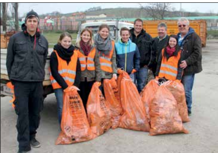
STOP LITTERING: Im Rahmen der Aktion Stop Littering wurde von der Kolpingjugend eine Stadtreinigung durchgeführt. Dabei konnte ein große Menge an herumliegenden Müll gesammelt und im Sammelzentrum fachgerecht entsorgt werden.