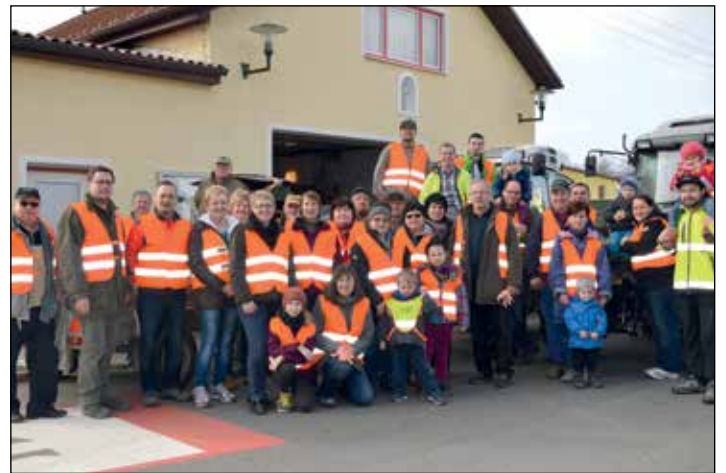
FLURREINIGUNG IN KLEINHADERSDORF: In Kleinhadersdorf wurde eine Flurreinigung durchgeführt. Insgesamt zwei Traktoranhänger und zwei Autoanhänger Müll jeglicher Art konnten dabei von zahlreichen freiwilligen Helfern aus der Natur entfernt werden.