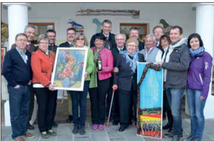
VERSTEIGERUNG ZUGUNSTEN OKENFUSORGE: Das Orgelkomitee hat zu einer Sonderverkaufsausstellung mit einer Versteigerung zugunsten der Okenfusorgel ins Weingut Taubenschuss eingeladen. Die Verkaufsausstellung bietet interessante Kunstwerke und läuft noch bis 30. Juli 2016.