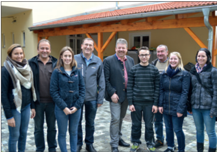
WANDERTAG DER JVP ALTRUPPERSDORF: Bereits zum 15. Mal organisierte die Jugend Altruppersdorf den Herbstwandertag am 26. Oktober. An die 150 Wanderer erfreuten sich über die Wanderung an der 10 km langen Strecke und stärkten sich bei den drei Labstationen.