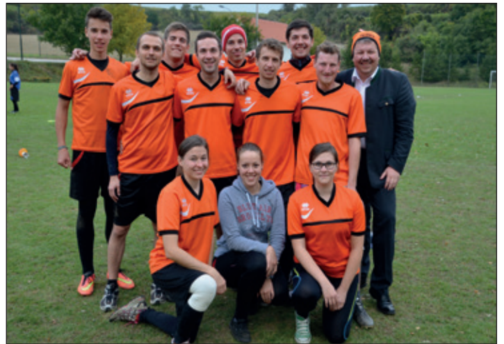
FRISBEE-TURNIER: Der Poysdorfer Frisbee-Club Nitro Circles veranstaltete auch heuer wieder ein Top-Turnier in Poysdorf. Zum dritten Mal waren die besten Frisbee-Spieler Österreichs zu Gast im Weinviertel.