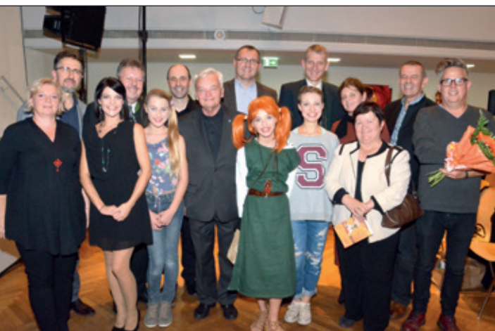
BETTY BERNSTEIN MUSICAL: Dank der tollen Schauspieler, Musiker und Sänger war die Welturaufführung des Betty Bernstein Musicals im Kolpinghaus Poysdorf ein voller Erfolg und begeisterte das Publikum. Besonders herausragend war die Beteiligung der Poysdorfer Schulen und des Chores „Sing & Swing“.