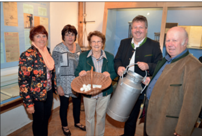
LANGE NACHT DER MUSEEN: Im Rahmen der Langen Nacht der Museen präsentierte sich auch das Milchammermuseum in Ketzelsdorf. Bis spät in die Nacht konnten sich dabei die Besucher über die damalige Zeit informieren und die Sonderausstellung über „Kosmetik mit Milch“ bestaunen.