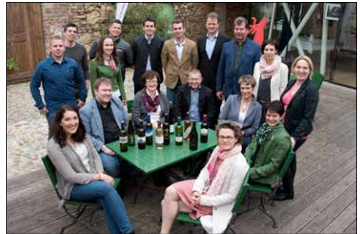
WEINTOUR WEINVIERTEL: Das Wein.Tour.Opening im Eisenhut-Haus wurde wieder von zahlreichen Gästen besucht, die sich von der Vielfalt an Qualitätsweinen aus dem Veltlinerland überzeugen konnten. Die Poysdorfer Winzer werden ab Mai wieder wöchentlich ihre Weingüter öffnen.