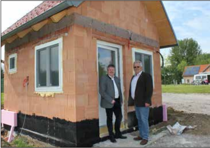
CAMPING REZEPTIONSGEBÄUDE: Am Veltinerland Campingplatz Poysdorf wurde ein neues Rezeptionsgebäude errichtet. Für die moderne Abwicklung der Verrechnung wurde auch eine neue Software angeschafft. Als zusätzliches Service steht am Campingplatz auch ein WLAN-Internet zur Verfügung.