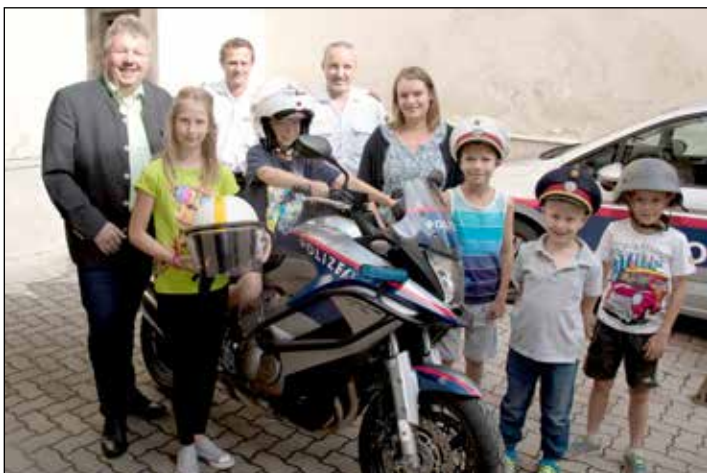
FERIENSPIEL: Auch heuer bietet Poysdorf wieder ein spannendes Ferienspiel für unsere Kinder. Ein besonderes Erlebnis war die Besichtigung der Einsatzfahrzeuge unserer Polizei. Das Abschlussfest mit Sommerdisco findet am Freitag, 1. September um 16 Uhr statt. Infos und Programm unter www.poysdorf.gv.at