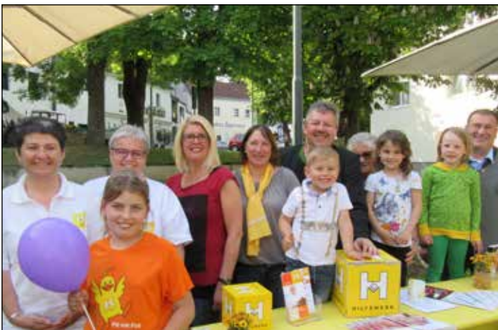
FAMILIENKIRTAG: Eine gelungene Veranstaltung war wieder der Hilfswerkkirtag in der Gstetten. Neben kulinarischen Köstlichkeiten und unterhaltsamer Musik präsentierte das Hilfswerk Poysdorf ihr vielfältiges Angebot rund um Pflege und Betreuung von Jung bis Alt.