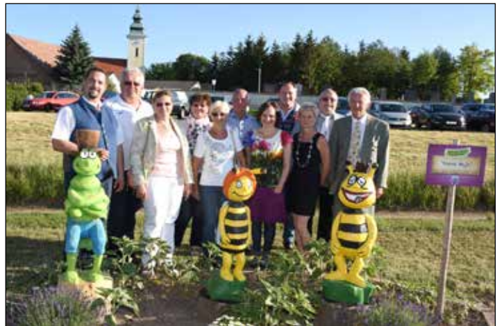
START-EVENT: Mit dem Start-Event startete das Märchendorf Poysbrunn in die Saison. Mit dem Märchen „Peter Pan und Tinkerbell“ wird sich der Märchensommer auch im heurigen Jahr wieder unter den TOP-Kulturevents Niederösterreichs einreihen.