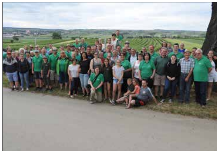
AUSFLUG: Der Kleinhadersdorfer Oldtimerklub organisierte einen Tagesausflug mit den Oldtimertraktoren mit insgesamt 95 TeilnehmerInnen durch die Region um Poysdorf. Insgesamt war der Oldtimerklub mit 13 Traktoren und einem Oldtimerfeuerfahrzeug ausgerückt.