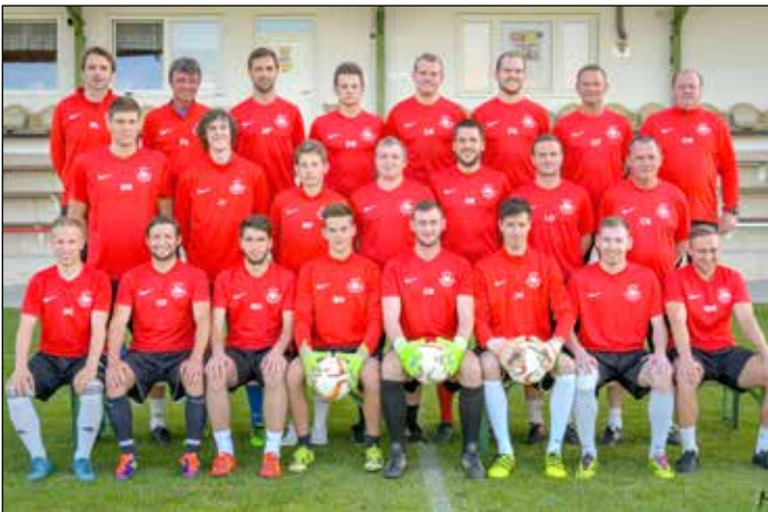
MEISTERTITEL: In einem spannenden Saisonfinale sicherte sich der SCU Poysbrunn/Falkenstein im letzten Match der Saison mit einem 3:0 gegen Niederabsdorf den Meistertitel der 2. Klasse Nord und wird damit in die 1. Klasse aufsteigen. Herzliche Gratulation zu diesem großartigen Erfolg!