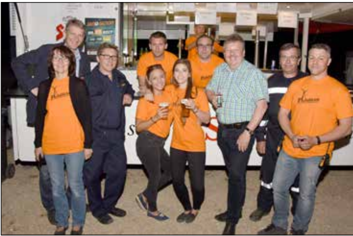
FLAUDAN: Ein Jugendfest der besonderen Art ist Flaudan in Wetzelsdorf, das alljährlich von der Freiwilligen Feuerwehr Wetzelsdorf bei den Windkraftanlagen abgehalten wird.