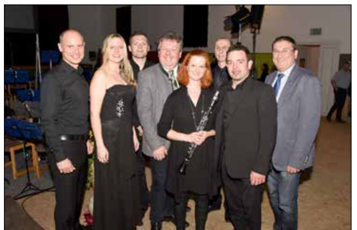
NACHT DER FILMMUSIK: Der Musikverein Poysdorf und Umgebung lud zur „Nacht der Filmmusik“ in die Sporthalle Poysbrunn ein. Die Besucher waren von der Qualität der Darbietungen begeistert.