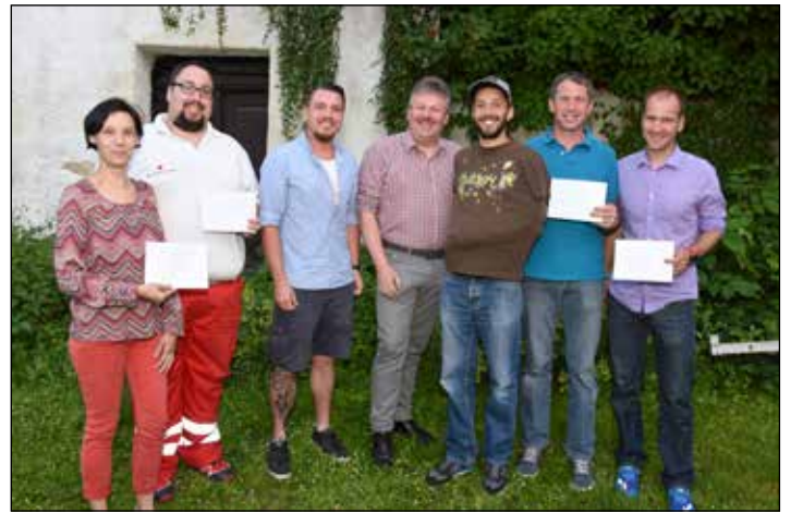
THE GSTETTNER: Der Reinerlös des Gstettner Clubbings wurde der Feuerwehr, dem Roten Kreuz, der Visionsgruppe Poysdorf und den Kolping-Behinderten-Einrichtungen zur Verfügung gestellt.