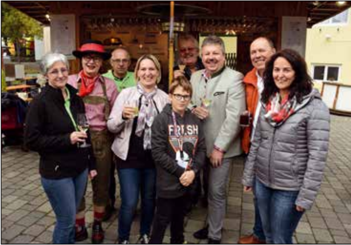
STURMFEST: Im Oktober fand in der Gstetten wieder das Poysdorfer Sturmfest statt. Zu verkosten gab es roten und weißen Sturm und dazu Bodenständiges aus der Küche. Eröffnet wurde das Sturmfest mit dem traditionellen Poysdorfer Winzerlauf am Samstag.