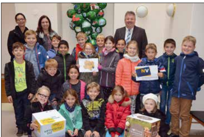
JAUSENBOXEN DETEKTIVE: Die 3. Klassen der Volksschule Poysdorf beteiligten sich am LEADER Region-Ideenwettbewerb „Jausenboxen-Detektive“ und gestalteten dazu kreative Werke, welche im Rathaus und in einer Auslage der NÖ Versicherung ausgestellt sind. Den Kindern wurde dabei das Interesse an regionalen Produkten geweckt.