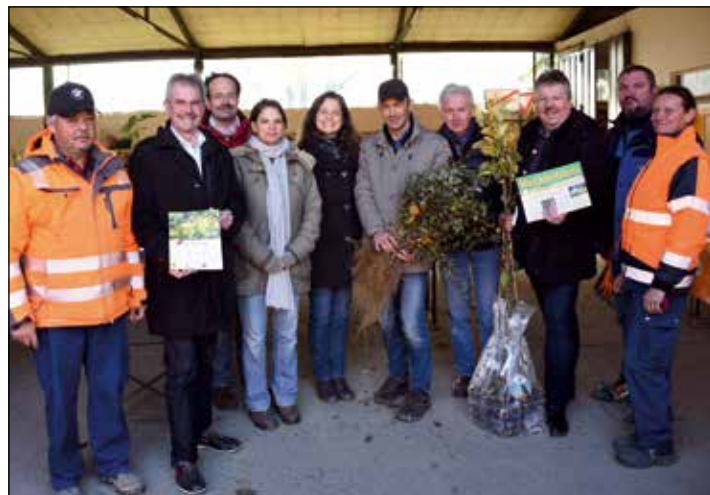
HECKENTAG: Auch in diesem Jahr fand wieder der Niederösterreichische Heckentag in Poysdorf statt. Viele nutzten die Möglichkeit sich, heimische Bäume und Sträucher zu kaufen.