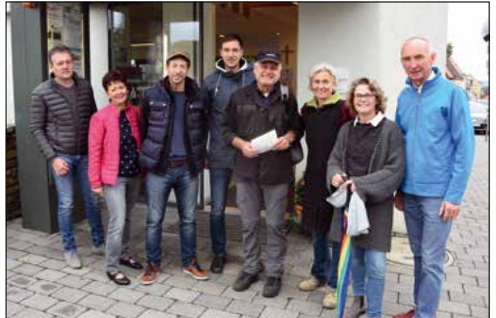
GEH-SPRÄCH: Die „Visionsgruppe Poysdorf 2025“ organisierte gemeinsam mit dem Architekturnetzwerk ORTE ein GEHspräch durch Poysdorf, welches andere und neue Blickwinkel, Ausblicke und Wertigkeiten aufzeigte.